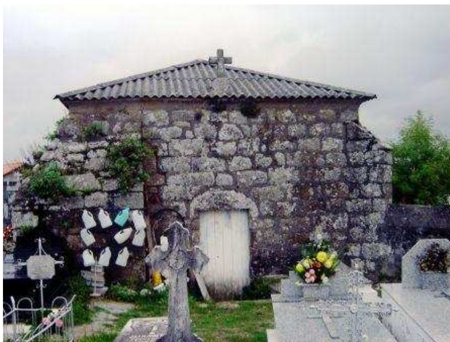
Capilla de los Serantes. Vista exterior.