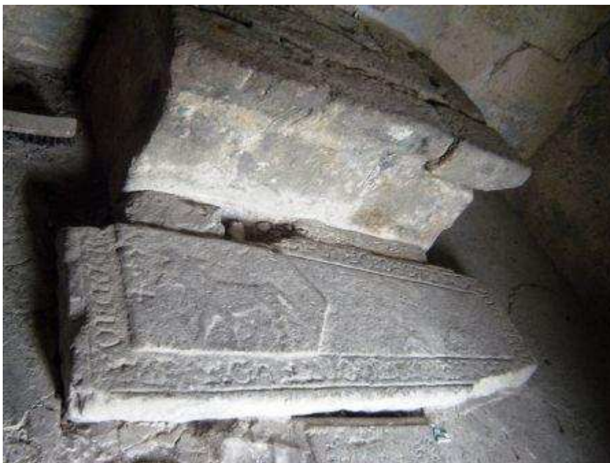
Capilla de los Serantes (Cementerio de San Salvador de Serantes, Ferrol).

I. JUAN DE SERANTES. Señor de la Casa y Torre de Serantes (1), en la feligresía de San Salvador de Serantes; y de los cotos de Serantellos, y Vilar (Santa Marina); todos ellos actualmente dentro de los límites del ayuntamiento de Ferrol. Tenía parte en el Beneficio de la feligresía de Serantes, compartido con la Casa de Andrade, y el propio cura de la iglesia (2). Sirvió como soldado desde 1502 en las guerras de Italia, en el famoso Batallón Gallego al servicio de su capitán, el conde don Fernando de Andrade; de quién Juan de Serantes era